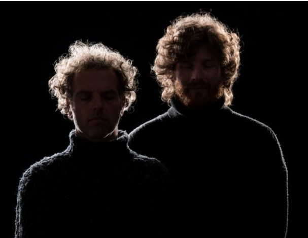
Klänge im Dunkeln Musik