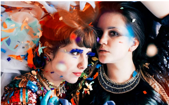
Eclecta Musik