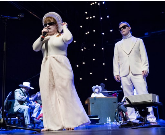
Theater Hora Theater / © Theater Hora, Sava Hlavacek