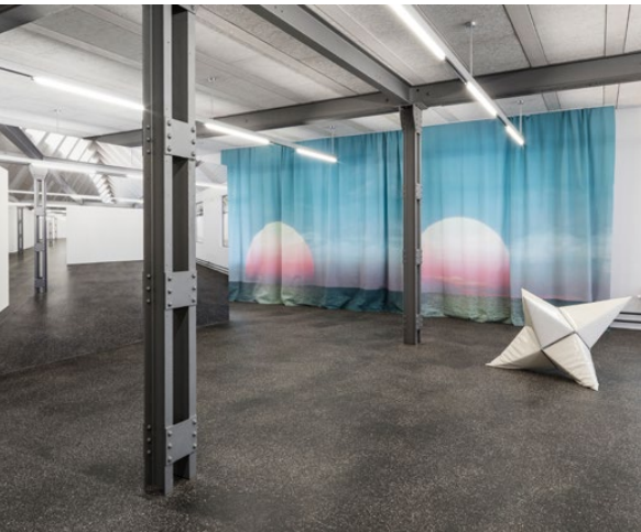
Tarnen, täuschen, imitieren Ausstellung