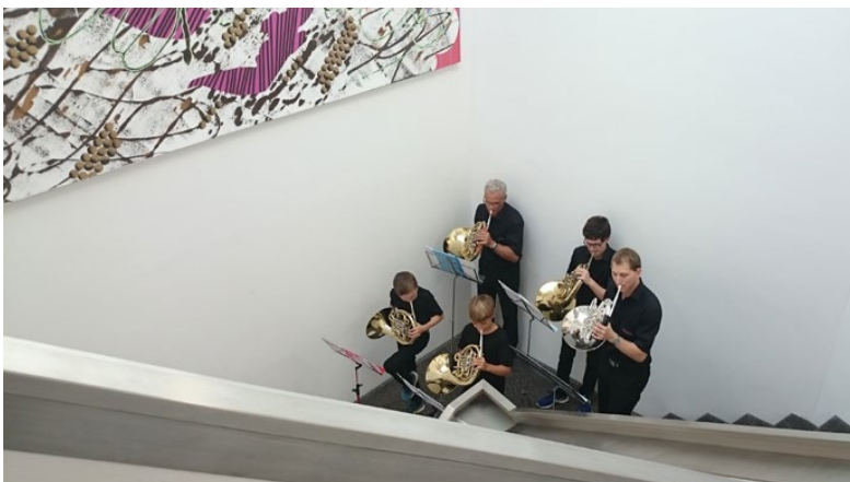
Kultur Verein(t) Kulturnacht