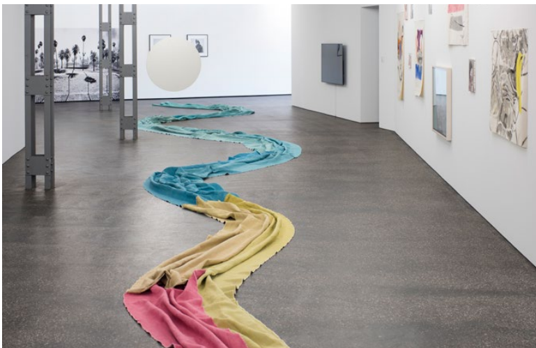
Gut gespielt Ausstellung