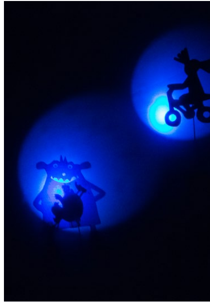
Theater Lenz Kinder-/Jugendtheater