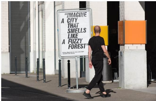
Was in der Luft liegt Aktionen und Performances