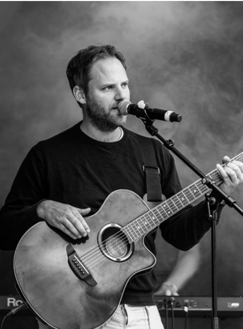
Simon Musik / ©Josef Bürgi