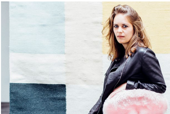
Tilia – Daniela Hallauer Musik / © Valentina Verdescha