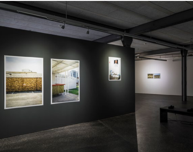
Forever or in a hundred years Ausstellung