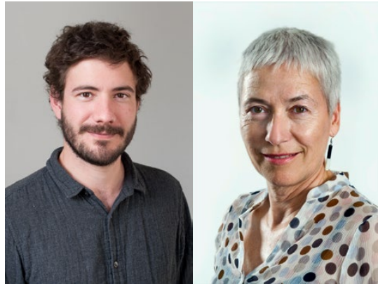
Lebenskreise Moderierte Lesung