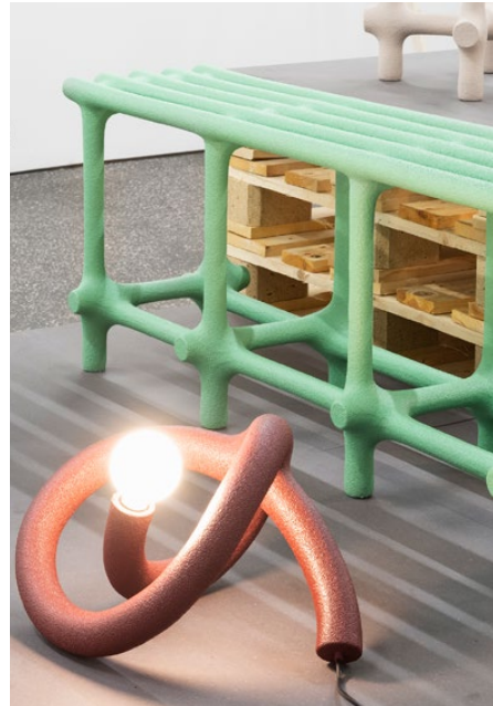
Designpreis Ausstellung